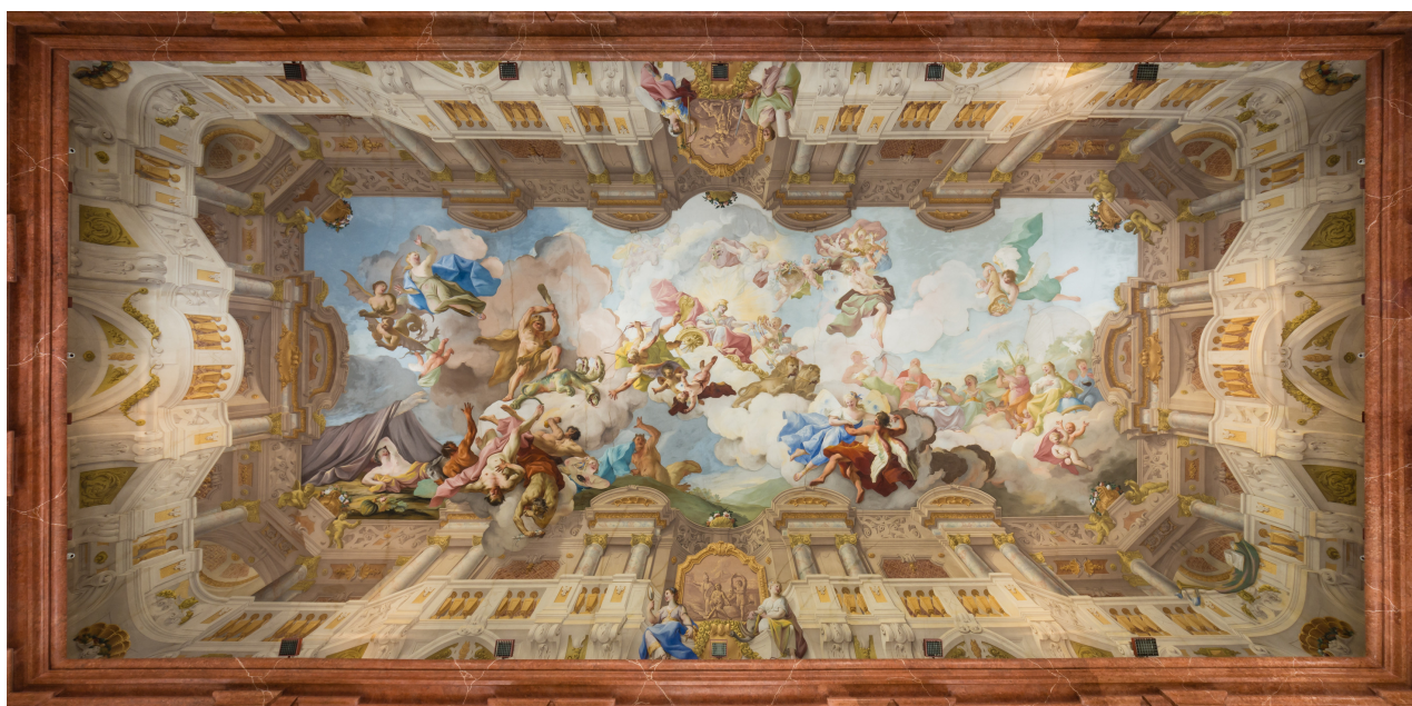
Fresk Paula Trogera w sali marmurowej biblioteki w Melku

Ponadto w zbiorach znajduje się 750 inkunabułów – najcenniejszych ksiąg powstałych do 1500 roku. Biblioteka w Melku jest podzielona na dwa główne pomieszczenia. Fresk w większym pomieszczeniu stanowi duchową przeciwagę do fresku z sali marmurowej. Ukazana jest tu alegoria wiary: kobieta, która trzyma książkę z siedmioma pieczęciami, owieczkę z Apokalipsy i tarczę z gołębicą (symbolem Ducha Świętego), otoczona figurami aniołów i alegorycznych przedstawień 4 cnót kardynalnych (mądrości, sprawiedliwości, męstwa i umiarkowania). Uwagę zwracają misternie zdobione regały z ciemnego drewna oraz zabytkowe oprawy ksiąg.