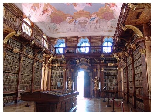
Biblioteka w Melku

Szczególne wrażenie na zwiedzających robi jednak imponująca biblioteka z freskami autorstwa Paula Trogera (1698–1762), w której zgromadzono księgozbiór liczący ponad 100 tysięcy woluminów, w tym 1800 rękopisów, m.in. odpisy Wergiliusza z X–XI wieku. Znaleziono tu fragment odpisów Pieśni o Nibelungach z XIII wieku. Najstarsze z rękopisów datowane są na IX stulecie.