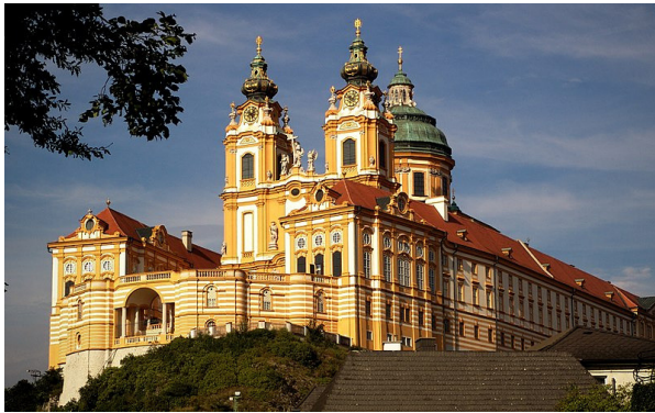
Opactwo benedyktynów w Melku

Jadąc na południe Europy warto odwiedzić Melk, malownicze miasto nad Dunajem w Dolnej Austrii. Niewątpliwą atrakcją przyciągającą turystów jest górujące nad miastem opactwo benedyktynów – jedno z największych i najwspanialszych w Austrii. Klasztor w Melku był inspiracją dla włoskiego pisarza Umberto Eco, który umieścił tam akcję jego najstynniejszej powieści Imię róży .