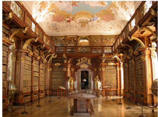
Wnętrze biblioteki opactwa w Melku